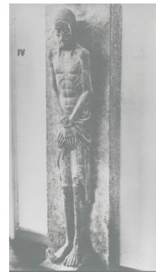
„der Schmerzensmann“ geschaffen 1930 als Aufnahmeprüfung für die Akademie München, heute Kriegerdenkmal in der Kirche St. Martin